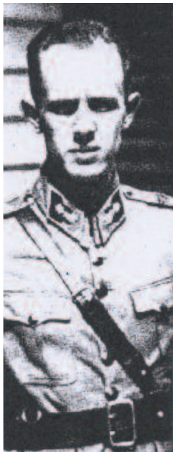
UIT ONS LEGER 61 (1977) 3, BLZ. 61