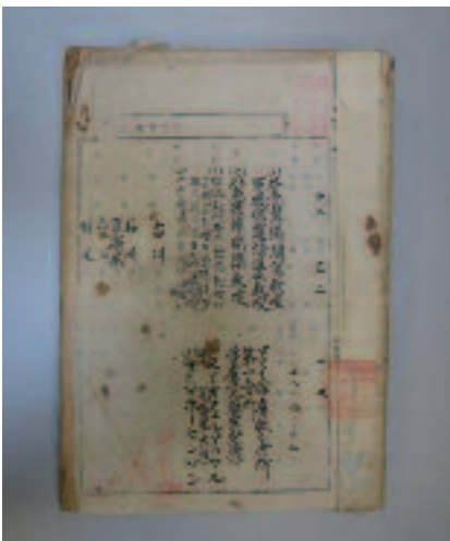
Voorkant van een van de twee Japanse procesbundels met bewijsstukken van het proces tegen Overakker en Gosenson (Uit: de Japanse procesbundels van het Overakker-proces, Indische Collectie 3093)

Een uitgebreide analyse van de processtukken en de verklaringen wekt de indruk dat de Japanse autoriteiten, ondanks een aantal zwakke punten, het proces in grote lijnen volgens internationale rechtsopvattingen hebben gevoerd.