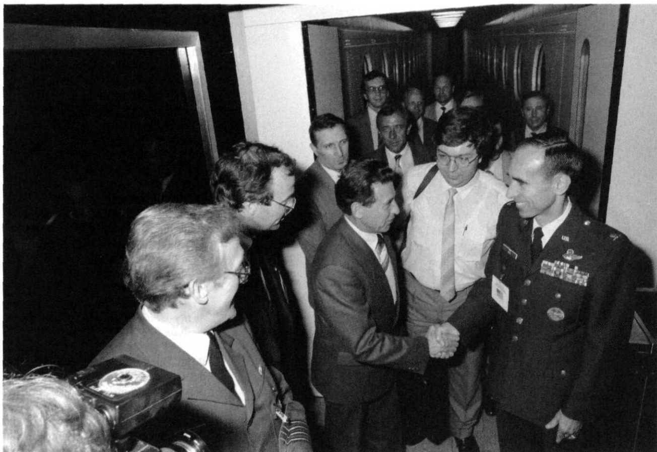
Aankomst van inspecteurs uit de Sovjet-Unie op de Vliegbasis Woensdrecht naar aanleiding van het INF-verdrag inzake de ontmanteling van kruisvluchtwapens, 29 juli 1988

niet lang daarvoor een jachtvlieger in een gewetensconflict over deze missies geraakt en had hij de dienst voortijdig moeten verlaten.