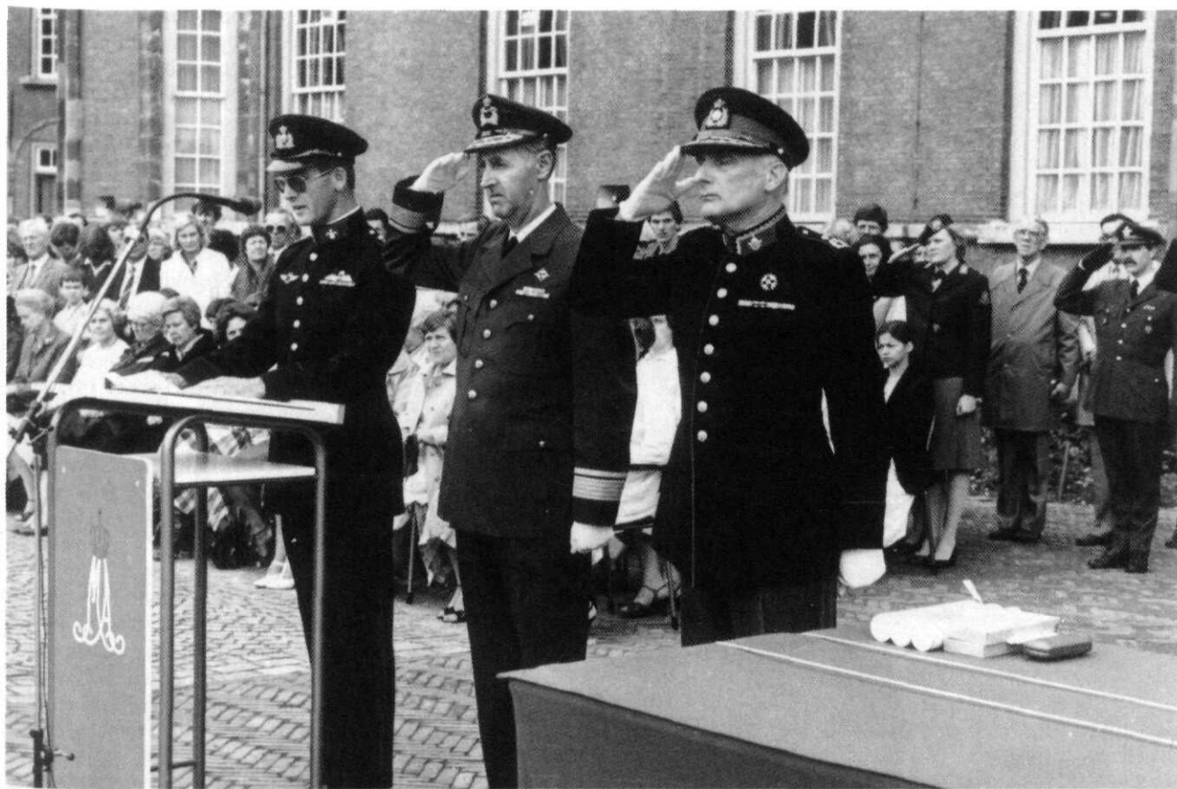
Commando-overdracht van de Koninklijke Militaire Academie door generaal-majoor M.H. von Meijenfeldt aan generaal-majoor D. Klik, 11 juli 1980

nucleaire en conventionele overmacht bij het Warschaupact. Hij maakte in het tweede artikel gebruik van een debaterstrucje door een opmerking mijnerzijds betreffende de onmogelijkheid van een conventionele NAVO-aanval voor het doel van zijn redenering uit te breiden naar elke strategische positie van de NAVO: als de onzekerheid als fundament van die strategie immers schijn was, zouden de heren in Moskou nooit iets hebben te duchten en zou de neutronenbom dus ook niet als hefboom kunnen werken.