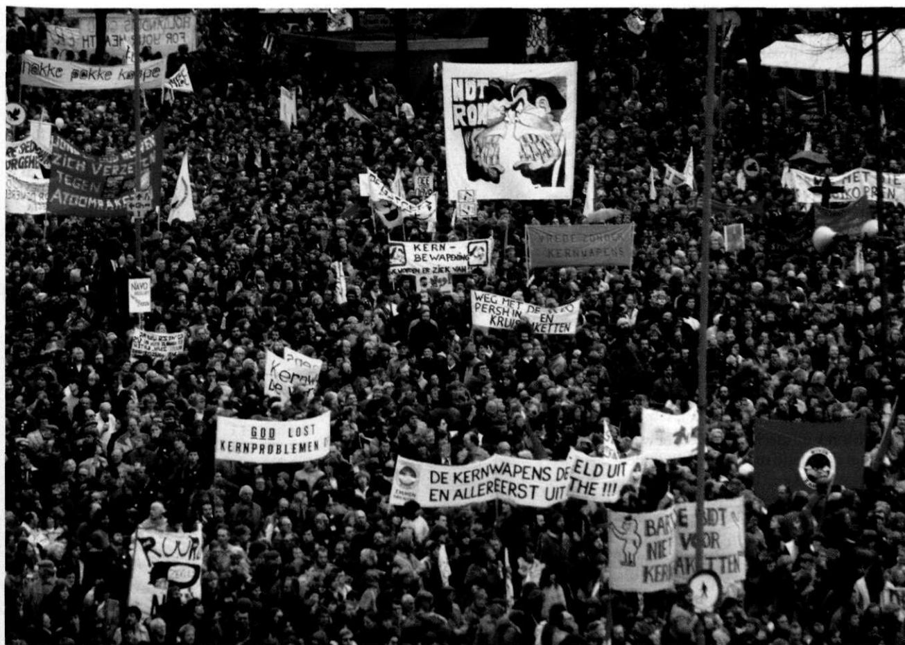
Demonstratie tegen kernwapens in Amsterdam, 21 november 1981