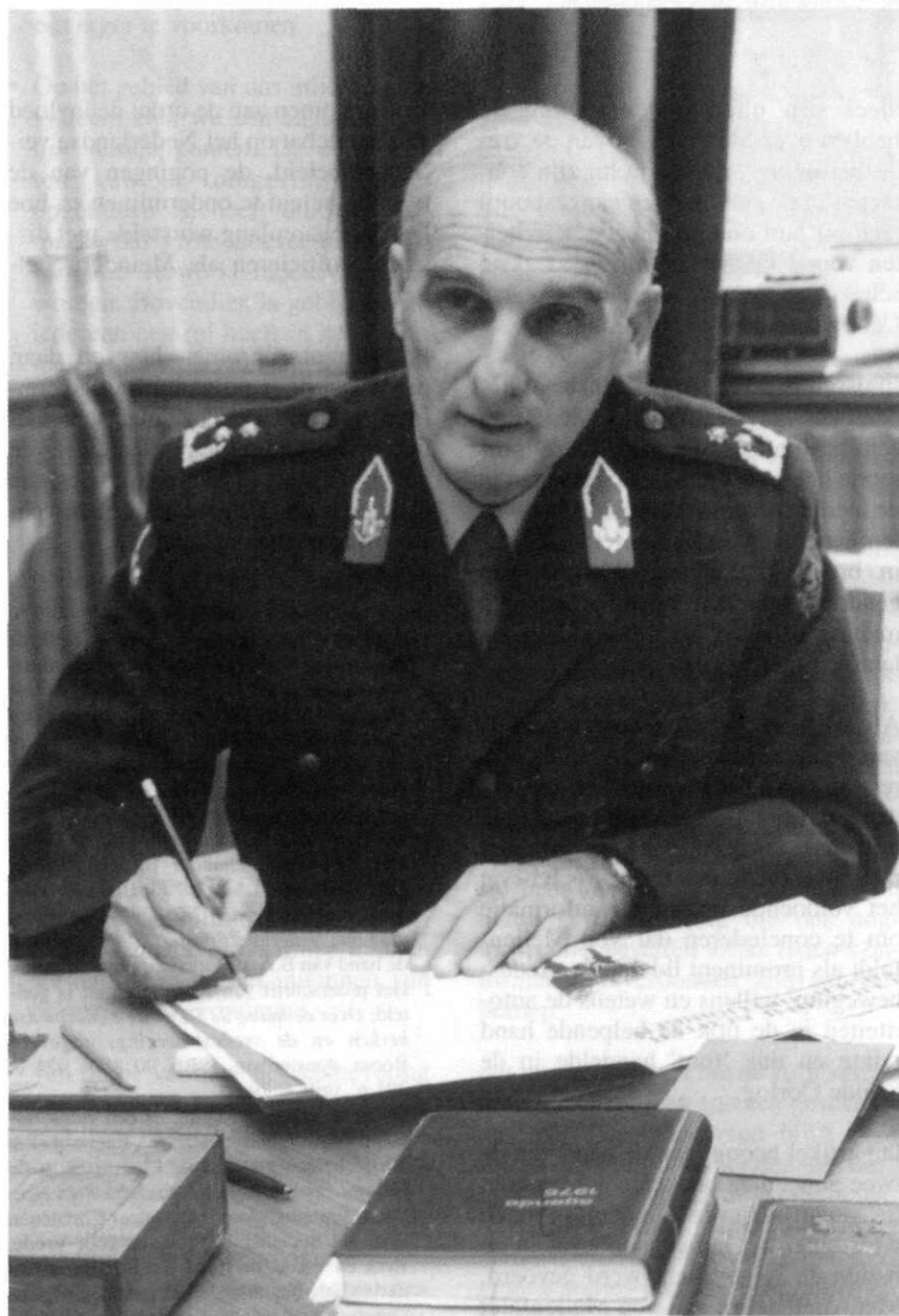
Genmaj M.H. von Meijenfeldt

Voorts sprak ik de verwachting uit dat de neutronenbom in elk geval de Sov- jets zou kunnen aanzetten serieus te onderhandelen. Een maand later re- pliceerde Von Meijenfeldt met de be- wering dat 'de bewapeningswedloop door de neutronenbom eerder werd gestimuleerd dan geremd', gegeven de