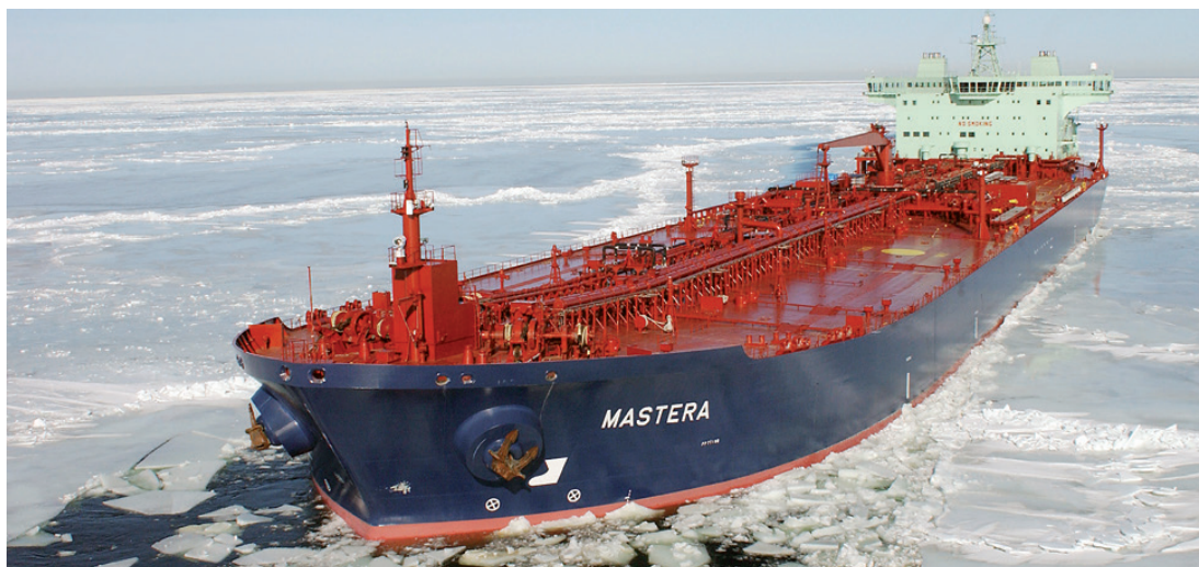
MT Mastera, één van de twee Finse olietankers die tevens als ijsbreker is gebouwd

Bij een milieuramp in het Noordpoolgebied kan iedereen zich wel wat voorstellen, maar hoe kun je dat voorkomen? Dat kan door in de Arctic Council en de UNCLOS goede afspraken te maken, regelingen op te stellen en deze vervolgens te controleren en, indien nodig, af te dwingen. Vooral voor dit laatste zijn mogelijk kustwacht, politie of militaire middelen nodig. Dit betekent overigens niet meteen het militariseren van de Noordpool; dat zou Rusland en