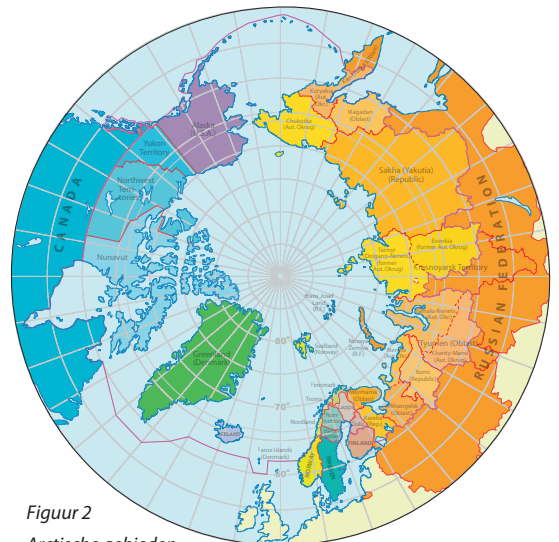
Figuur 2 Arctische gebieden

Over welk gebied gaat het eigenlijk als we spreken over de Noordpool of het Hoge Noorden? Er zijn vele definities mogelijk: ten eerste de hele Arctic Ocean , ten tweede alle landen met territorium binnen de Poolcirkel 66 graden Noorderbreedte, ten derde gebieden met een gemiddelde temperatuur die lager is dan 10 graden Celsius in juli, ten vierde – vanuit ecologisch perspectief – alle gebieden ten noorden van de boomgrens, en ten slotte het bevroren zee en permafrost gebied. Volgens mij gaan de meeste deskundigen en de Arctic Council uit van de tweede definitie: landen met territorium binnen de Poolcirkel.