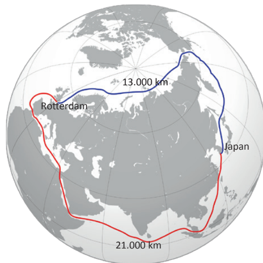
Figuur 3 De Noordoost-passage: 8.000 kilometer korter

Het gebruik van deze kortere routes scheelt veel tijd en brandstof. Bovendien is er op deze routes minder kans op piraterij. Daarnaast zullen er waarschijnlijk minder kwetsbare en kostbare (vanwege tolheffing) passages zoals het Suezkanaal en het Panamakanaal zijn, tenzij landen zoals Rusland tol of een andere bijdrage voor service op de route gaan heffen.