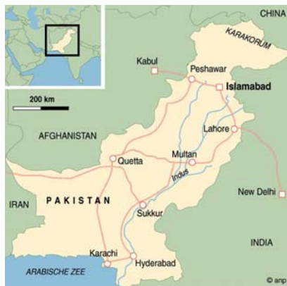
De ligging van Pakistan

Moskee in Islamabad, afgelopen juli, en op de uiteindelijke aankomst in Karachi, op 18 oktober van oud-premier Benazir Bhutto. Ook de aankondiging van Musharraf dat hij zijn uniform zal uittrekken als hij eenmaal is beëdigd als president, is ongetwijfeld het gevolg van druk van buiten. De westerse mogendheden hopen dat een regering onder Bhutto meer druk zal kunnen uitoefenen op het moslim-fundamentalisme dat vooral in de grensstreek met Afghanistan een machtige positie heeft verworven. Dat niet iedereen de komst van Bhutto op prijs stelde, bleek al dadelijk na haar aankomst toen in de avond van 18 oktober een tweetal explosies de dood veroorzaakten van meer dan 130 personen.