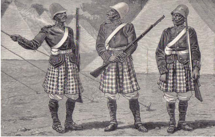
Lijfwacht van de Afghaanse amir, gekleed in Schotse kilt