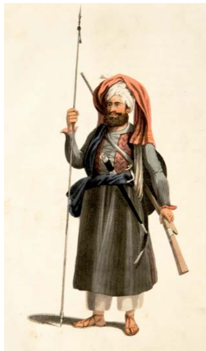
Pashtun uit het noorden van het huidige Pakistan

Tussen 1989, toen het Sovjet-leger Afghanistan verliet, en het einde van 2001, toen de Taliban hun greep op het land verloren, speelde Pakistan nog steeds een belangrijke rol in het land. Eerst steunde Pakistan de Afghaanse oppositieleider Gulbuddin Hekmatyar, die probeerde om de