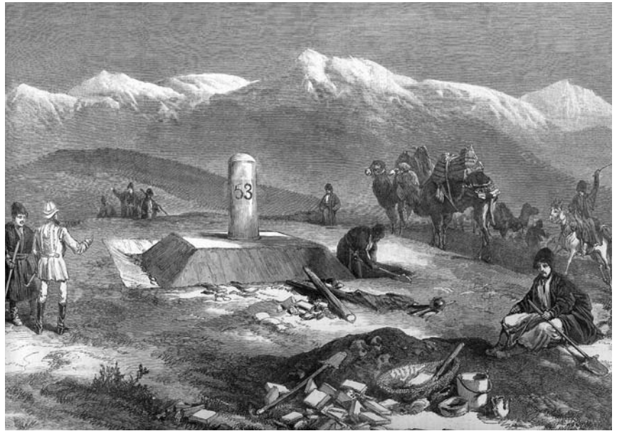
Britse officieren helpen bij het afbakenen van de noordelijke grens van Afghanistan

Op het snijvlak tussen een 'seculier' Afghanistan en een 'religieus' Paki-