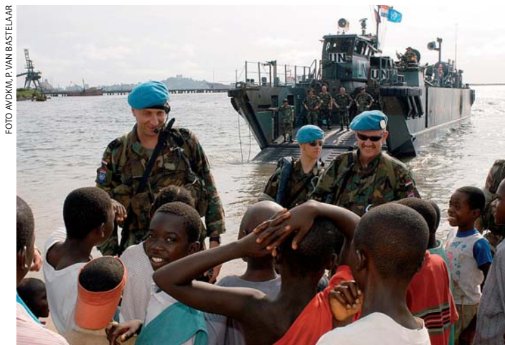
De commandant van Hr. Ms. Rotterdam ontmoet de Force Commander van UNMIL

De gebeurtenissen op het Plein van de Hemelse Vrede hebben wel degelijk bij het bewind de ogen geopend en de noodzaak tot meer open-