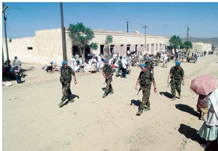
Een zogeheten 'sociale patrouille' tijdens UNMEE, Eritrea