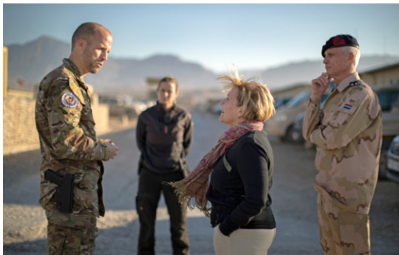
Werkbezoek in Afghanistan in 2018: aan de verantwoordelijkheid voor 65.000 mensen van wie velen met gevaar voor eigen leven werken zaten zowel mooie als moeilijke aspecten