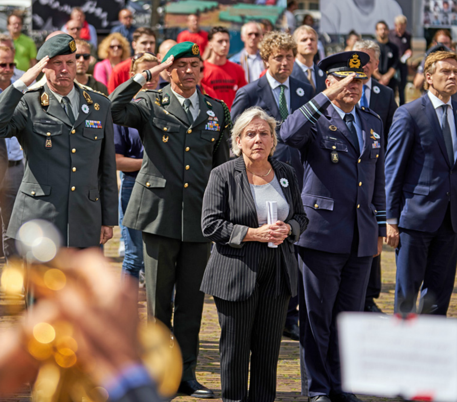
Bij de Srebrenica-herdenking in 2020: 'We hebben gewerkt aan een publiek eerherstel voor de veteranen van Dutchbat III'

genomen hoe belangrijk het is om interesse te tonen voor de krijgsmacht. In het werk van onze militairen, maar ook in de personen die zij zijn. En hoe belangrijk het is om waardering te laten zien.