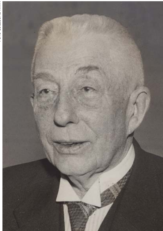
Dr. H. Colijn

Mijn vertrouwen in de bruikbaarheid van het leger in de eerste dagen na het mobilisatie bevel is niet groot. Maar, hoe vreemd het ook klinkt, overbelangrijk acht ik dit niet. Voor ons is niet zozeer van betekenis wat het leger onmiddellijk bij en na de mobilisatie kan doen, maar of wij op een iets later oogenblik nog zullen beschikken over een troepenmacht, die men een georganiseerd leger kan noemen. Dit betekent dat wij de hoofdkrachten van het leger in de eerste paar weken niet moeten blootstellen aan ondernemingen, die tot een algemeene vernietiging zouden kunnen leiden. 6