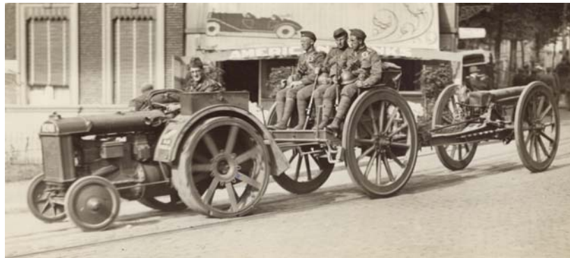
Zware artillerie tijdens een oefening, september 1928

Deze situatie roept de vraag op hoe de legerleiding na de invoering van het legerstelsel van 1922 reageerde op de toenemende spanning tussen het concept van het Veldleger enerzijds en de werkelijke aard en capaciteiten van het leger anderzijds.