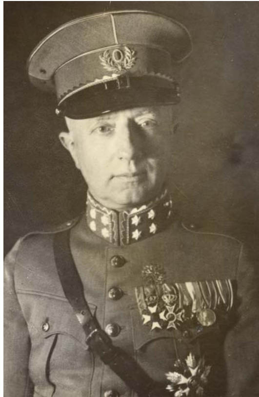
Generaal I.H. Reijnders

‘een sterk, goed geoefend en goed toegerust operatief orgaan’, dat wil zeggen een modern Veldleger. 4 Generaal-majoor I.H. Reijnders, sinds 1 mei 1934 chef van de Generale Staf, liet zich uit bezorgdheid over de nog onvoldoende gevechtskracht van het Veldleger zelfs verleiden tot de gedachte dat weinig minder dan de vrede in Europa afhing van de afschrikking van het Veldleger in Noord-Brabant. 5