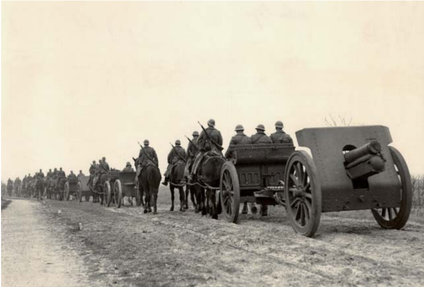
Een afdeling veldartillerie met een houwtiser '15 lang 17' tijdens een oefening, mobilisatie 1939-1940

jaar waarin de Nederlandse krijgsmacht op voet van oorlog verkeerde, de mobilisatie van 1914-1918 en omdat het Interbellum eindigde met een nieuwe mobilisatie, die van 1939-1940 en een vijfdaagse oorlog in mei 1940. Welke rol speelde het Veldleger die twee keer in werkelijkheid?