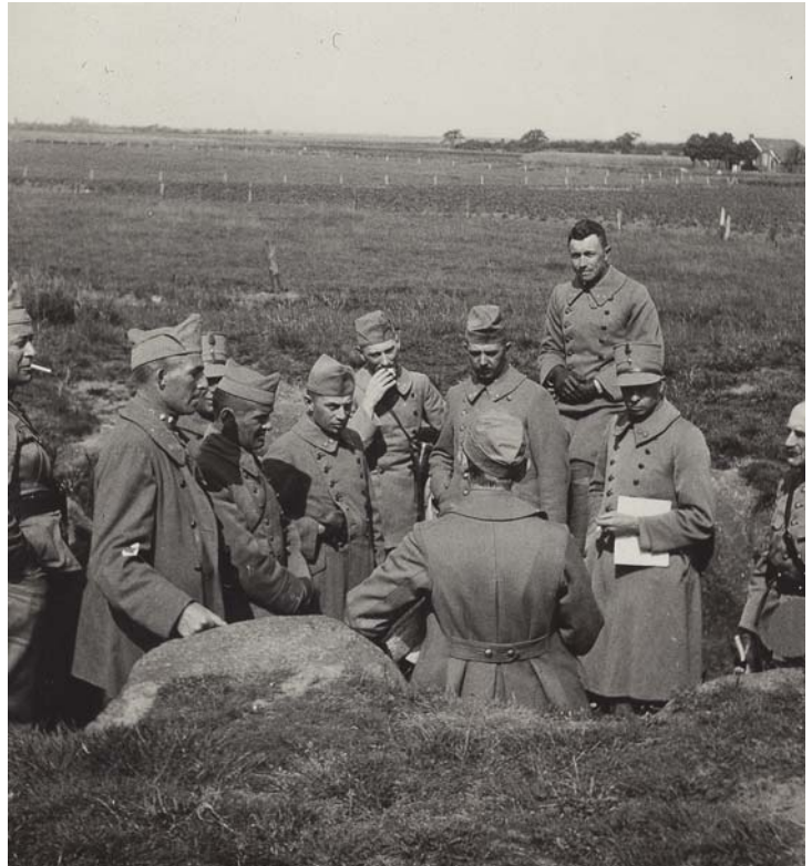
Beeld uit een tactische oefening zonder troepen in de noordelijke provincies, juni 1932

De eerste conclusies betreffen dingen die geheel of nagenoeg geheel ontbreken in de scenario's. Geen enkele oefening veronderstelt een gang van zaken als in 1914, dus het geval dat de afschrikking van het Nederlandse leger slaagt en Nederland zijn gewapende neutraliteit handhaaft. Dat wijkt af van stafoefeningen van vóór de Eerste Wereldoorlog, die deze mogelijkheid wel beoefenden. Deze vaststellingen stemmen overeen met de eerder genoemde conclusies over de verminderde werking van de militaire afschrikking en het Europese machtsevenwicht. Een volgende negatieve score betreft de kust en de Koninklijke Marine. Na de Eerste Wereldoorlog concentreerden de oefeningen van de Generale Staf zich praktisch volledig op de dreiging over land vanuit het oosten.