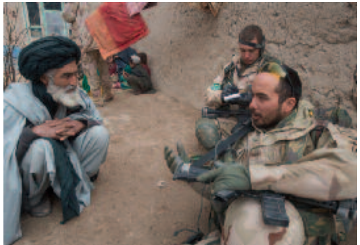
ISAF strijdt met de Taliban om de steun van de bevolking. Daarmee is de opinie een ‘gevechtsveld’ geworden

publiek duidelijk worden gemaakt wat de civiel-militaire bandbreedte van zo’n operatie is. Mooie maar vage metaforen en ‘alomvattende benaderingen’ doen geen recht aan de militaire noodzaak van een precieze invulling en een nauwlettend toezicht op naleving van de gekozen COIN-strategie.