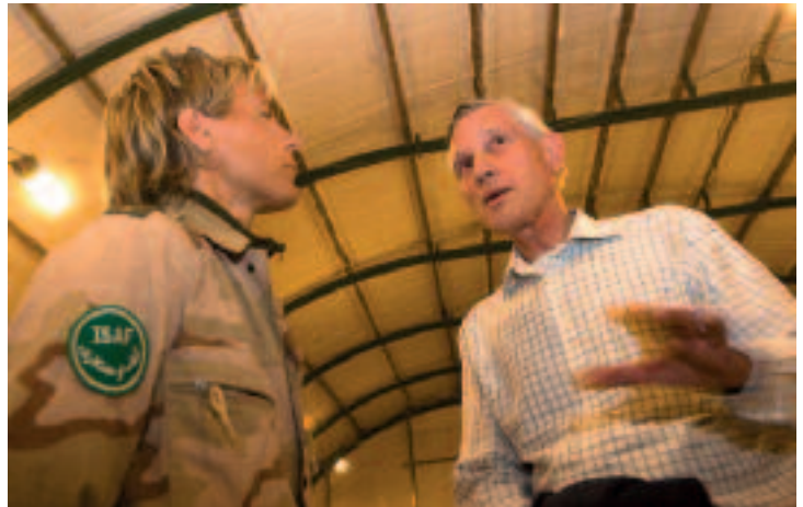
Voormalig minister Ben Bot op bezoek bij Nederlandse militairen in Tarin Kowt. 'Wederopbouw kan niet zonder een goed inzicht in clan- en familiestructuren, in mogelijke bronnen van conflict en loyaliteiten'

droom over de globale jihad. Het zijn mannen die hun zorgen uiten of hun lokale belangen en waarden verdedigen tegen invloeden van buitenaf. 141