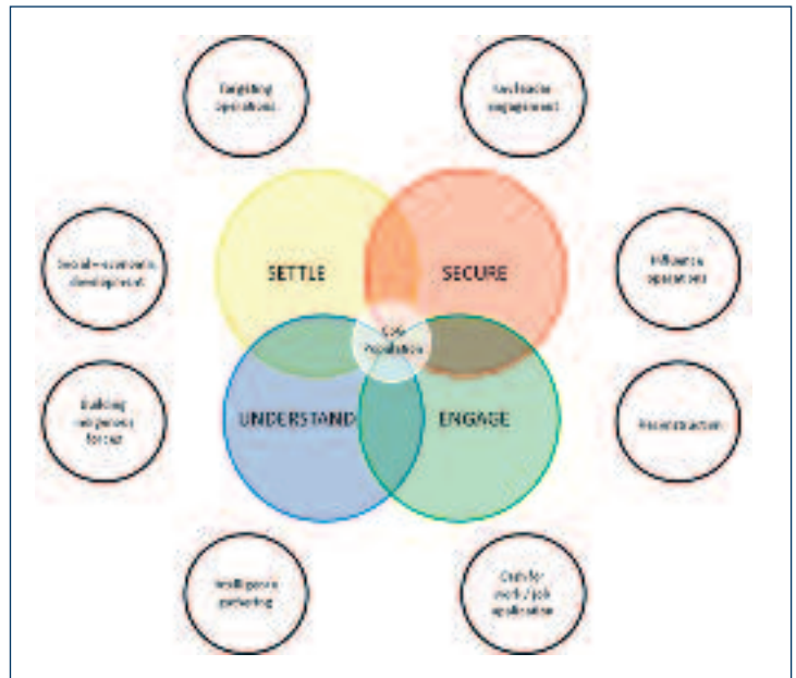
De vier kerntaken van een peloton of compagnie met de lokale bevolking als 'center of gravity'. Daaromheen de taken (niet uitputtend) waarmee de eenheden ondersteunen, maar die voornamelijk worden uitgevoerd door hogere niveaus

Het beveiligen van de lokale bevolking bestaat vervolgens uit overwegend defensieve activiteiten, al kunnen offensieve activiteiten niet altijd worden vermeden. 120 Wel dient in acht te worden genomen dat het gebruik van geweld soms