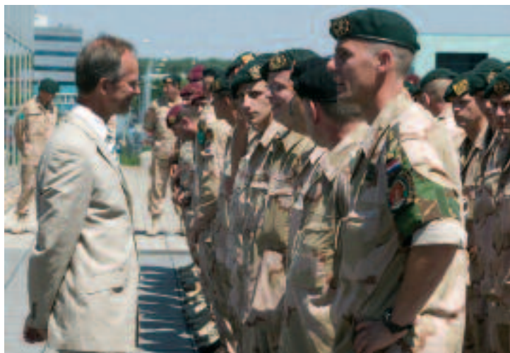
Voormalig minister van Defensie Henk Kamp onderkende het verband tussen veiligheid, stabiliteit en wederopbouw (Vliegbasis Eindhoven, 2006)

Wij moeten op bepaalde plaatsen, daar waar we niet kunnen opbouwen, bereid zijn om ook te vechten om die veiligheid te realiseren. 18