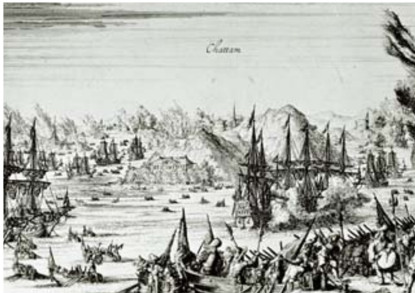
De Tocht naar Chatham, 1667

De Engelsen gaven hierdoor op zee het initiatief definitief uit handen en gaven de voorkeur aan het aanleggen van kustverdedigingen. In de Republiek maakte men dankbaar gebruik van de afwezigheid van de Engelse vloot om de handel weer op te pakken. Dit leidde tot een opleving van de economie. 22