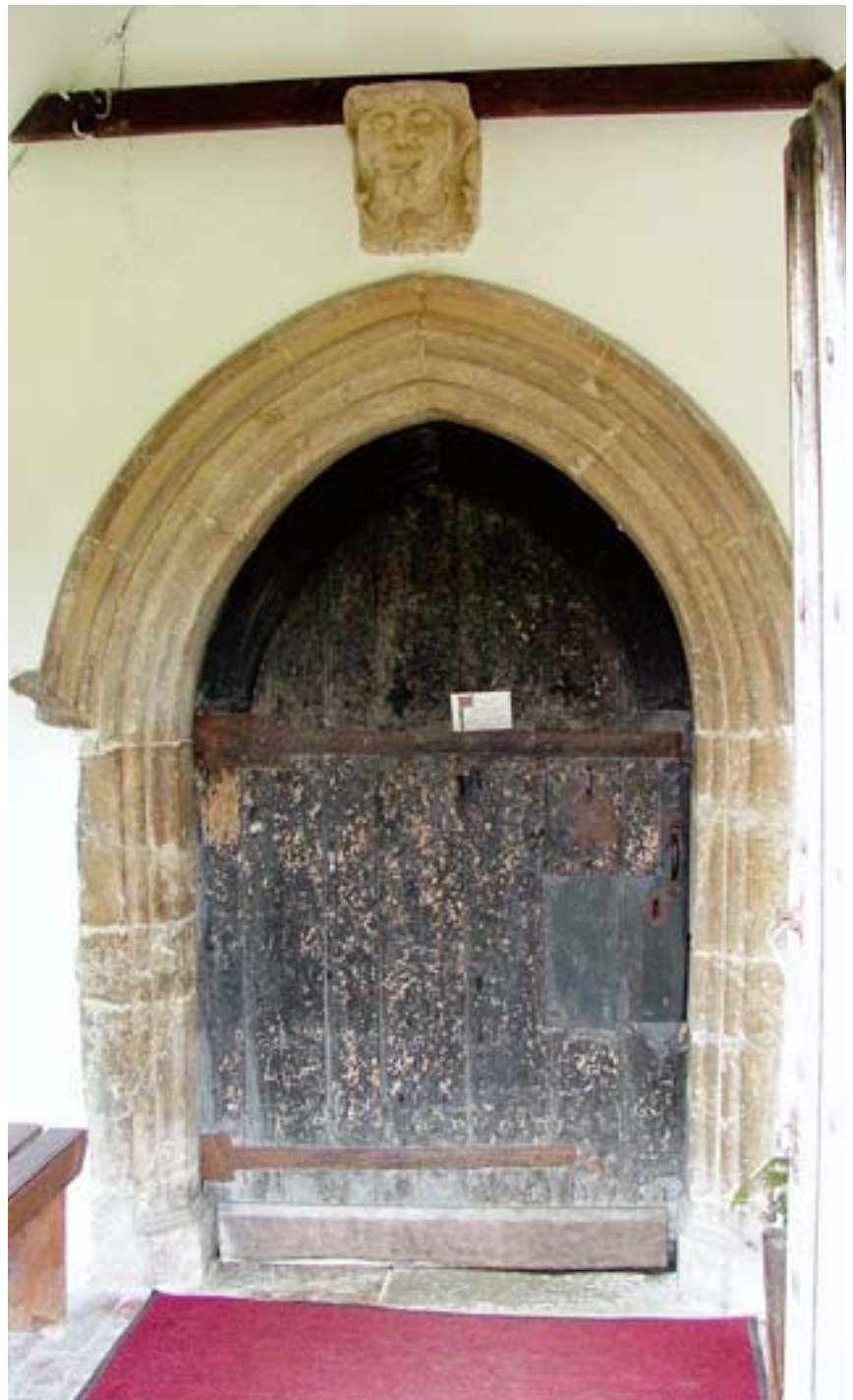
De gerepareerde kerkdeur van de St. James Church in Grain

Toen zij in het dorpje Grain aankwamen, probeerden zij de kerkdeur van de twaalfde-eeuwse St James Church te rammen. Nederlandse officieren belemmerden dit en lieten de schuldi-