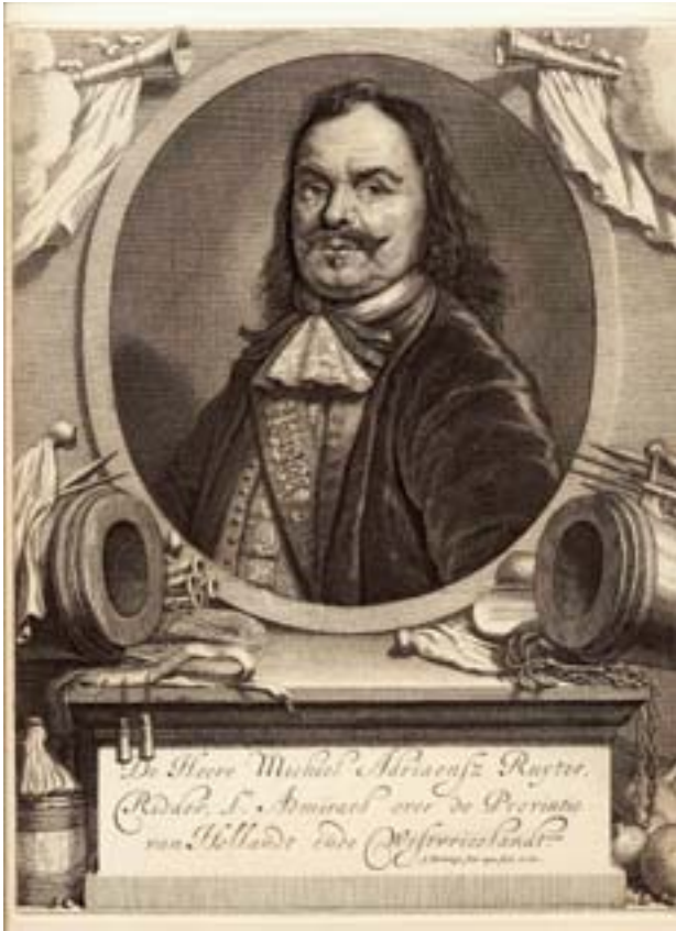
Michiel Adriaenszoon de Ruyter als luitenant-admiraal van de Admiraliteit van Rotterdam