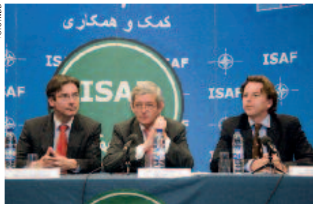
Niveaus van militair optreden: een gezamenlijk persmoment van de ministers van Defensie, Buitenlandse Zaken en Ontwikkelings-samenwerking

steeds vijf niveaus onderkend en in de LDP beschreven: