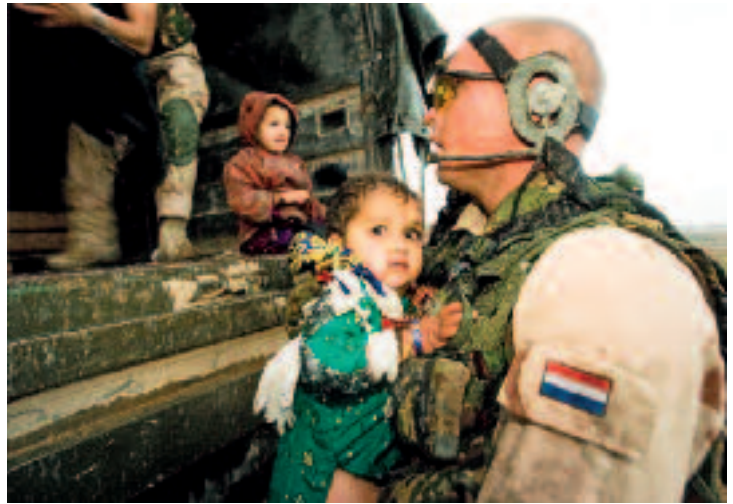
'Operaties zijn operaties': zo evacueren militairen van de Battle Group kinderen tijdens een overstroming in Deh Rawod

en leidend. Het kritisch beschouwen van de militaire doctrine blijft overigens niet beperkt tot de Nederlandse krijgsmacht. Internationaal werkt men, zowel in NAVO-verband als daarbuiten, hard aan de vernieuwing van een groot aantal doctrinepublicaties.