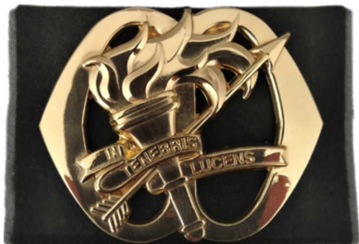
Het ontwerp voor het korps I&V

Het ontwerp voor het korps I&V wordt door de ontwerper van de Uniformcommissie aangepast en mondt uit in de bekende toorts met een naar boven wijzende pijl. De toorts, het internationale symbool voor inlichtingeneenheden, brengt licht in duisternis, vandaar het credo: In Tenebris Lucens . De pijl symboliseert concentratie, snelheid, verdediging en doelgerichtheid. De achtergrond van het embleem is groen met grijs.