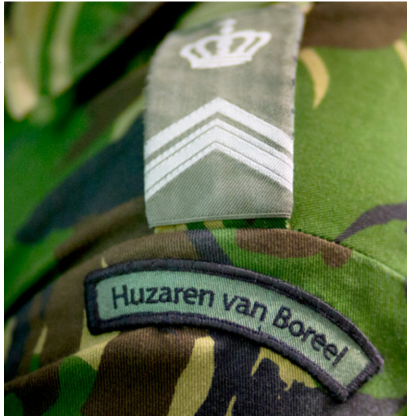
De Cavalerie herschikt zich in twee regimenten, waarvan het verkenningregiment Huzaren van Boreel er één is