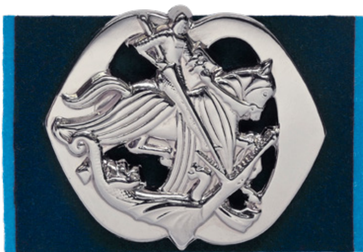
Het embleem voor het nieuwe tankregiment

De besluiten, die alle zijn ingegaan 20 november 2020, vinden hun beslag in het aangepaste Traditiebesluit Koninklijke Landmacht, waarin een aantal kleine omissies werd rechtgezet. 28 Vanwege de Covid-19-pandemie werd de oprichtingsceremonie behoorlijk aangepast en uiteindelijk in lijn met het nieuwe Wapen via een livestream uitgevoerd. 29 In een vraaggesprek met Commandant Landstrijdkrachten werd stilgestaan bij het belang van informatiemanoeuvre en de herschikking van de Cavalerie.