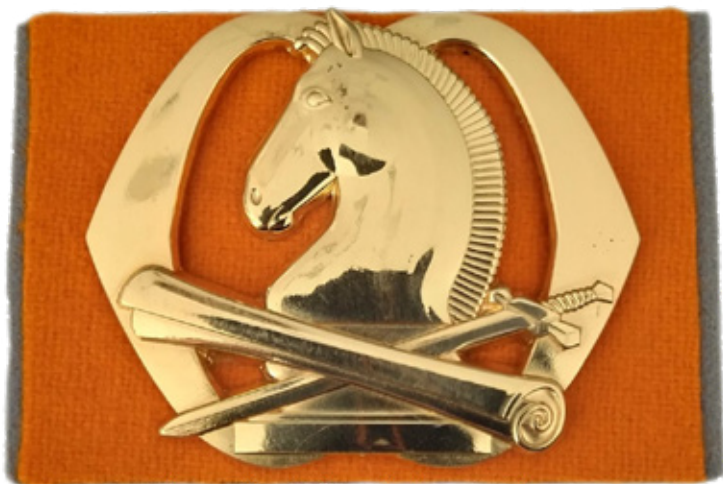
Het embleem van het korps C&E