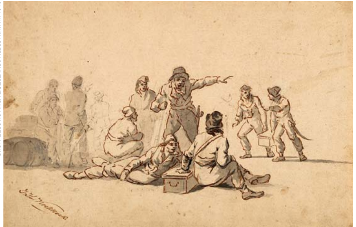
Aanmonstering van zeevolk, waarschijnlijk in Vlissingen, omstreeks 1800