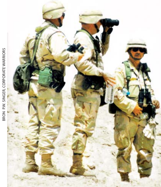
MPRI-personeel geeft observatietraining in Koeweit