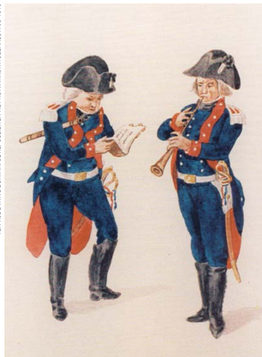
Muzikanten van het regiment Saxon-Gotha, 1799