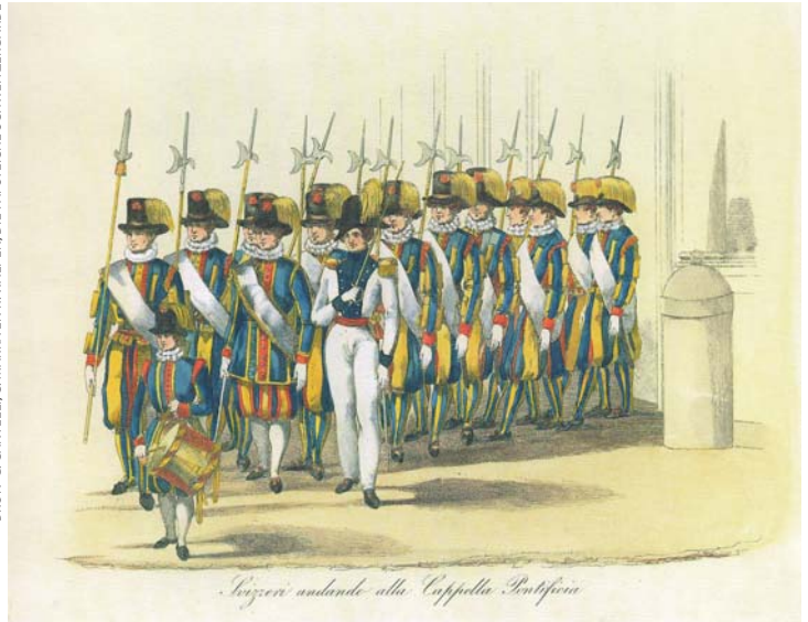
Pauselijke Zwitserse Garde, negentiende eeuw